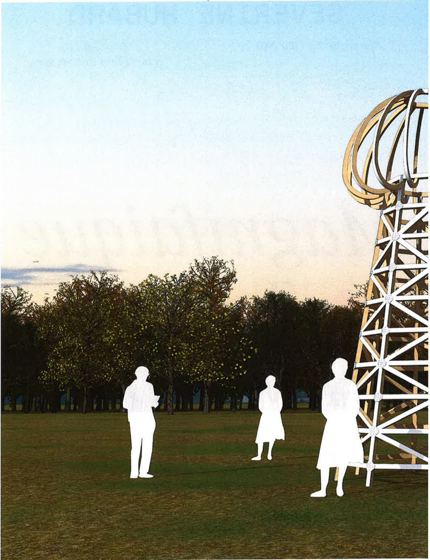
Magnifique Tower, Hommage à Nikola Tesla