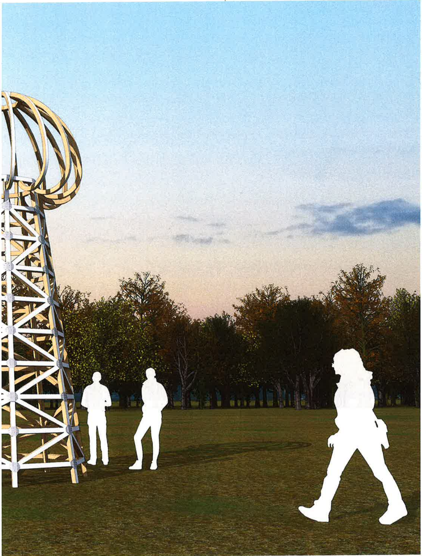
Séverine Hubard, simulation d'implantation de Magnifique Tower, Hommage à Nikola Tesla, 2021