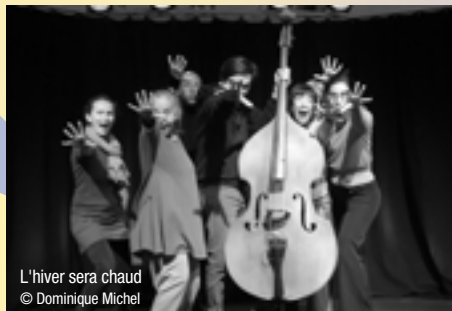
L'hiver sera chaud

Alors on s'assied, on écoute, on réfléchit, on propose, on s'oppose... On interagit avec sept artistes qui ne cessent de chanter, jouer, danser, improviser... Pour repartir avec la volonté de changer tout ça !